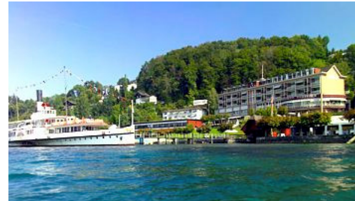
Seehotel Hermitage Luzern

Direkt am See mit herrlichem Blick auf den Vierwaldstättersee und die Innerschweizer Berge